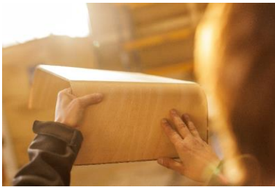
Bildtext: Produktionsaufnahme Weitzer Woodsolutions